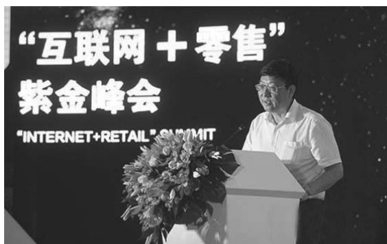
中国物流与采购联合会副会长蔡进

2015 首届“互联网 + 零售”紫金峰会上中国物流与采购联合会副会长蔡进在题为“互联网 + 物流：共享时代的云物流”的分论坛上发言