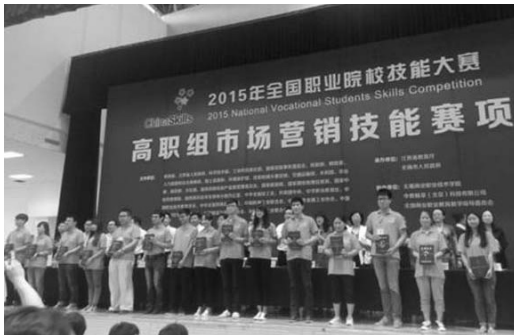
湖南现代物流职院学生上台领奖（右起第六位）

2015年6月5日，全国职业院校技能大赛高职组市场营销技能赛项经过一天时间的激烈角逐，在江苏无锡商业职业技术学院落下帷幕并举行了颁奖典礼。