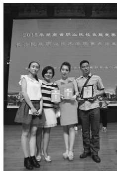
选手与指导老师合影