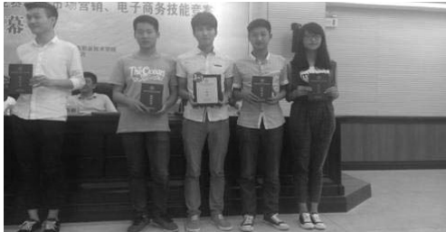
湖南现代物流职院学生上颁奖台领奖

2015 年 5 月 10 日，由湖南省教育厅主办、湖南商务职业技术学院承办的湖南省高职院校“市场营销技能大赛”全省总决赛经过一天时间的激烈角逐，在湖南商务职业技术学院落下帷幕并举行了颁奖典礼。