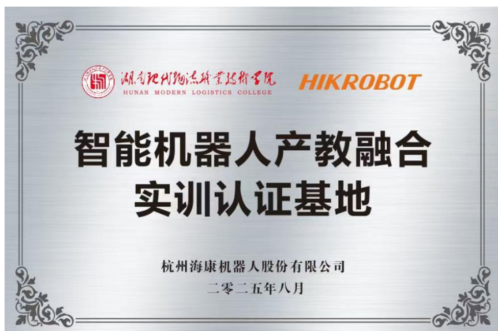
图 2-1 智能机器人产教融合实训认证基地

针对智能物流现场工程师培养与产业需求脱节的问题，联合湖南现代物流职业技术学院共建 400 m 2 产教融合实训基地（图 2-1），配备潜伏移动机器人、机器视觉、智能仓储管理系统等先进设备，软硬件总价值达 270 万元，1:1 还原企业真实工作场景。创新构建“企业认证+政府认证”双轨机制，引入海康 HCT/HCA 认证体系，并与国家职业技能等级标准对接，实现“实训教学—生产实践—技能鉴定—行业竞赛”全流程闭环，推动技术标准与人才能力深度融合。