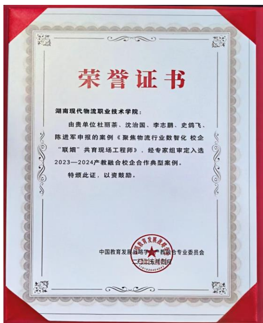
图 3-2 入选教育部 2023-2024 年产教融合典型案例