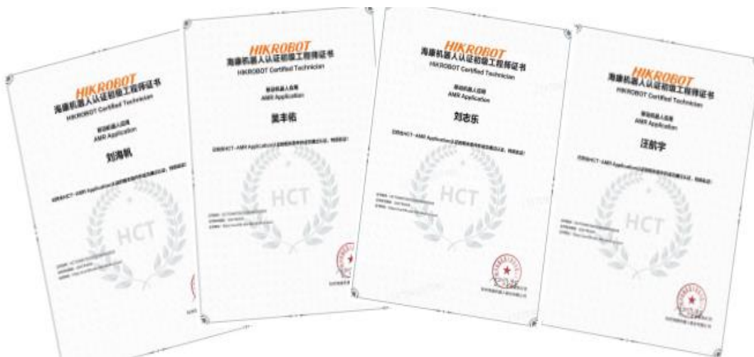
图 3-1 部分学生的 HCT 证书