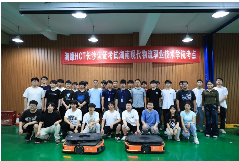
图 2-2 2023 级移动机器人现场工程师班认证考核