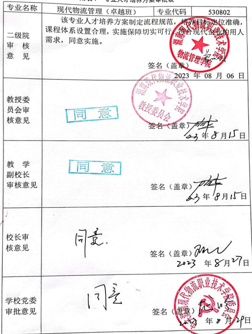
附表 7 专业人才培养方案审批表