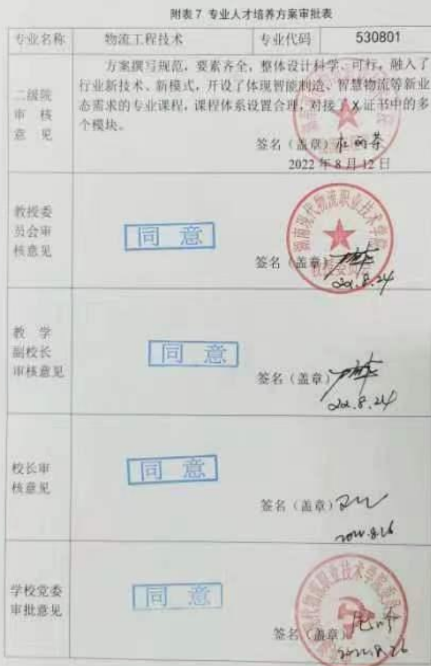
附表7： 专业人才培养方案审批表