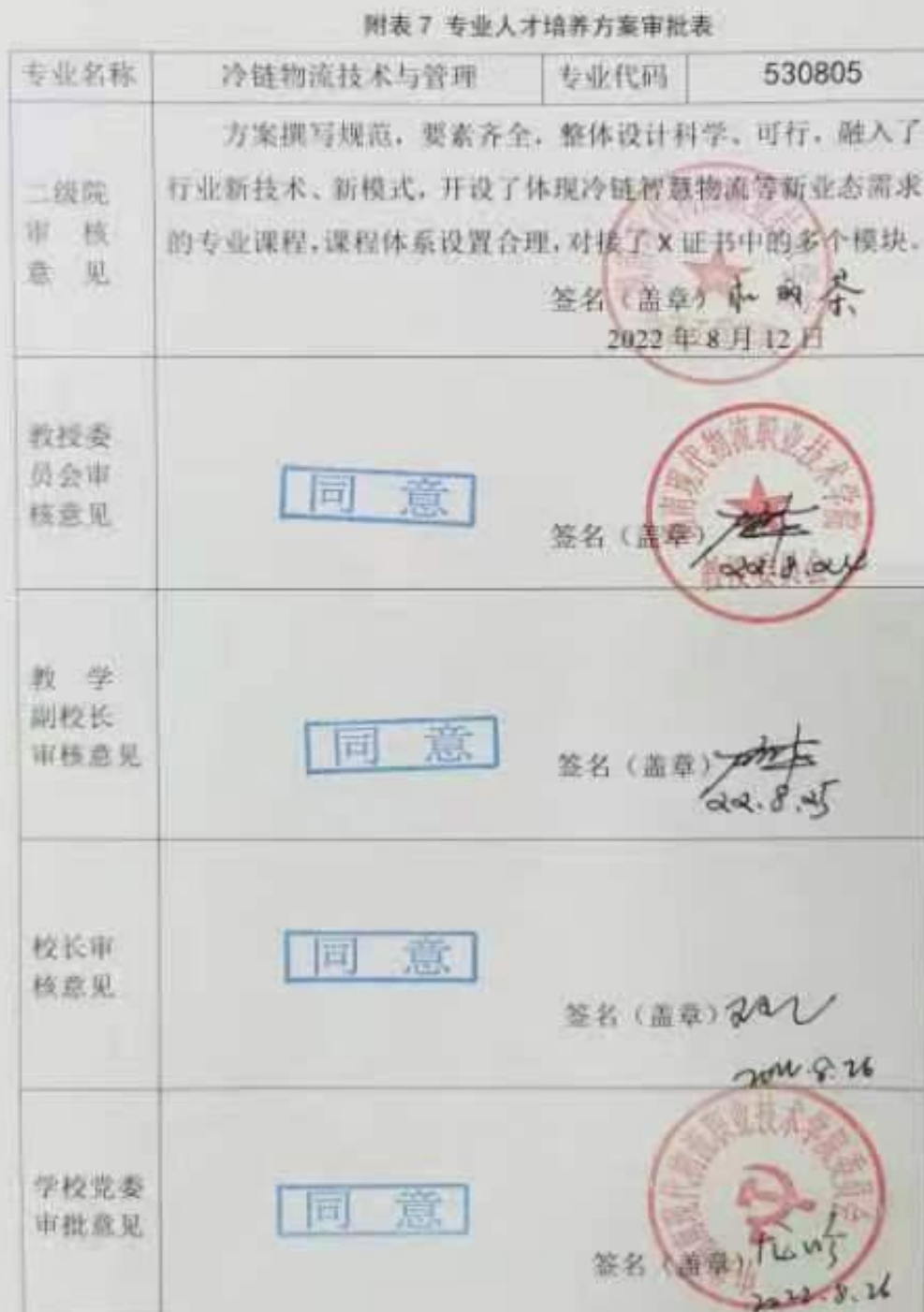
附表7 专业人才培养方案审批表